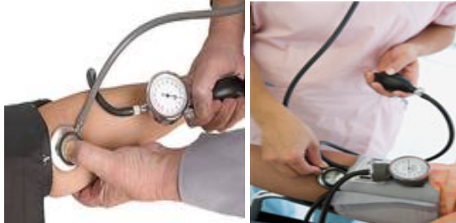
شکل ۷. نحوه قرار دادن گوشی روی شریان بازویی (براکیال)

می‌شود، در شنیدن صداهای کورتکوف اختلال ایجاد می‌کند. از ایجاد ضربه‌های خارجی و نابجا به گوشی در حین تخلیه هوای بازوبند بپرهیزید. در تمام مراحل اندازه‌گیری فشارخون باید به مانومتر نگاه کنید.