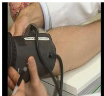
شکل ۵: بستن بازوبند

لوله‌های لاستیکی که از کیسه هوای لاستیکی خارج می‌شوند، معمولاً باید به سمت پایین دست قرار گیرند، اما می‌توان بازوبند را طوری بست که لوله‌های لاستیکی در بالای بازوبند قرار گیرد یا در صورتی که اندازه کیسه هوای لاستیکی مناسب دور بازو باشد، کاملاً با چرخش کیسه لاستیکی لوله‌ها در پشت بازو قرار گیرند، در نتیجه گذاشتن گوشی در گودی آرنج راحت تر انجام می‌شود. (شکل ۵)