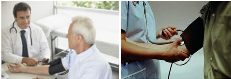
شکل ۳. قرار گرفتن بازو در سطح قلب