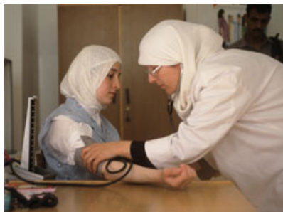
شکل ۴. بالا زدن آستین نازک لباس